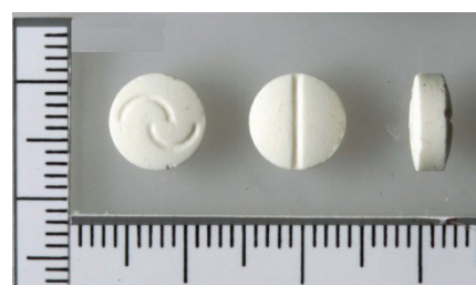
Comprimés de captagon