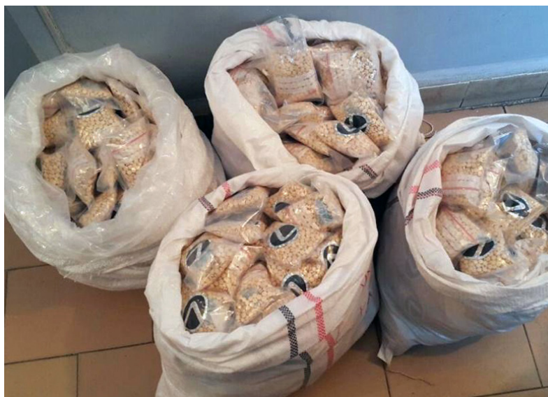
Comprimés de captagon saisis dans un laboratoire libanais

Un indice supplémentaire provenant, lui aussi, du Liban suggère que des experts européens participent à la synthèse illicite d'amphétamine au Proche-Orient. Le 29 décembre 2015, les commandos de l'armée libanaise découvrirent à Dar Al-Ouassa, village chiite de la région de la Bekaa, deux sites de production de captagon. L'un était dédié à la synthèse d'amphétamine (et peut-être de BMK) et l'autre à la fabrication des comprimés. Quoiqu'évoquée par Le Monde [61], cette affaire n'a pas eu un grand retentissement. D'après les photographies que des policiers libanais ont montré à l'auteur de ce travail, les cuves à réaction utilisées sur place ont un aspect fort similaire à celles, fabriquées sur mesure pour la synthèse illicite d'amphétamine (ou de MDMA), qui sont saisies à l'occasion de démantèlements de laboratoires clandestins aux Pays-Bas et en Belgique. La taille et le nombre des cuves et des autres équipements photographiés à Dar Al-Ouassa indiquent que le laboratoire disposait d'une importante capacité de production : plusieurs dizaines de kilos d'amphétamine par semaine au strict minimum. Quant à la presse à comprimés rotative photographiée sur place, un modèle Accura de la marque Fluidpack, sa capacité maximale est de 216 000 comprimés à l'heure d'après son fabricant indien [62] 19 .