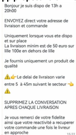
Photo : message envoyé via WhatsApp proposant la livraison de cannabis à Lille et en dehors